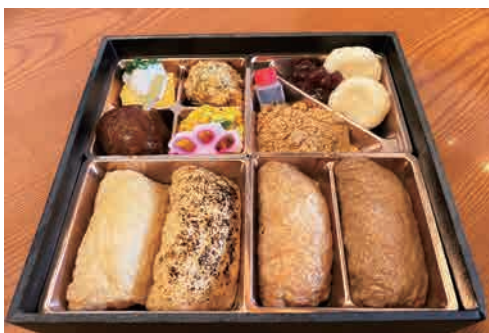
七宝いなり（弁当） 1,242円（税込）