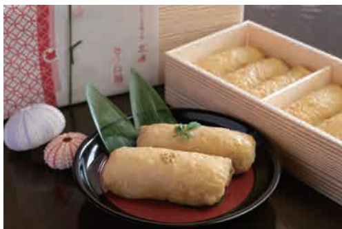
昔ながらのいなり 97円（税込）