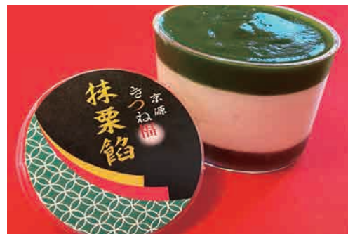
抹茶いなり 367円（税込）