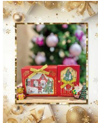
クリスマス焼き菓子ギフト