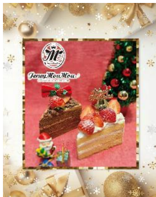
ショコラクリスマス (左) スイートクリスマス (右)