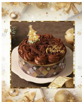
クリスマスショコラ