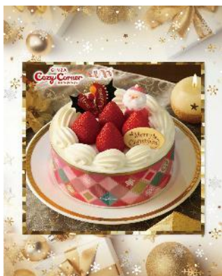
苺サンドショート

クリスマスを華やかに彩る、特別感あふれるケーキを販売いたします。定番人気のいちごのデコレーションケーキや会話のきっかけにもなるクリスマス限定のプチケーキなど、多彩なラインナップで皆さまをお待ちしております。