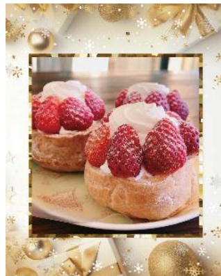
苺シュークリーム