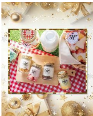
ミルクティラミス

那須のジャージー牛乳を使用した、ミルクスイーツ商品を販売いたします。お店で大人気のミルクティラミスや、季節限定のケーキなど可愛いスイーツが、いつもと一味違うクリスマスをお届けいたします。