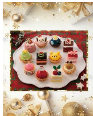
サンタ村のクリスマス（12個入）