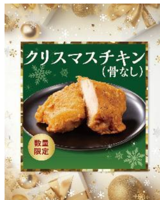
クリスマスチキン (骨なし)