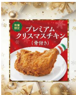
クリスマスチキン (骨付き)

大人気のとんかつ新宿さぼてんがクリスマスにぴったりなチキンや、こだわりのかつが入ったかつサンドなど、パーティーを盛り上げる商品を提供いたします。とんかつ専門店のこだわりの味をぜひお楽しみください。