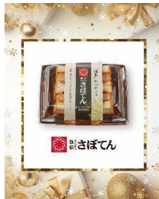
謹製ヒレかつサンド